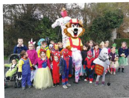
Défilé du Carnaval Samedi 17 mars