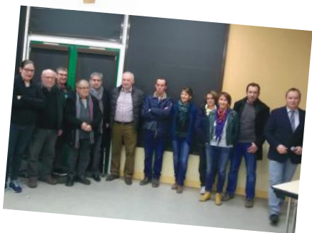
Voeux du Maire Vendredi 12 janvier