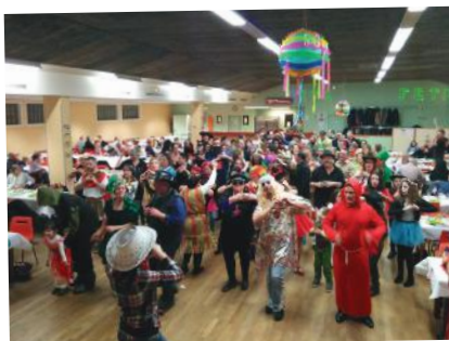
Repas du Carnaval Samedi 10 février