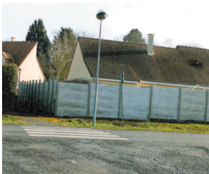
Exemple en zone UP, clôture interdite !

Le règlement du plan local d'urbanisme et les formulaires de déclaration sont téléchargeables sur notre site : https://stmarsdoutille.fr/votre-mairie/amenagement-du-territoire/44-urbanisme