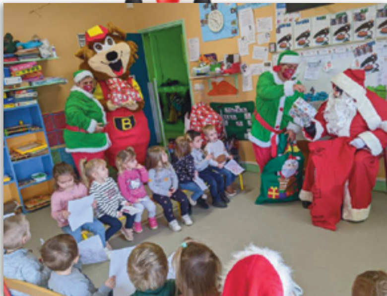
Noël à l'école maternelle