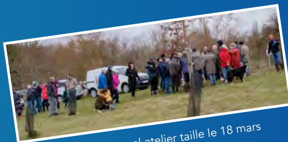
Verger communal atelier taille le 18 mars