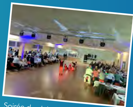
Soirée du club de basket le 18 mars