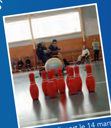
Journée Handisport le 14 mars