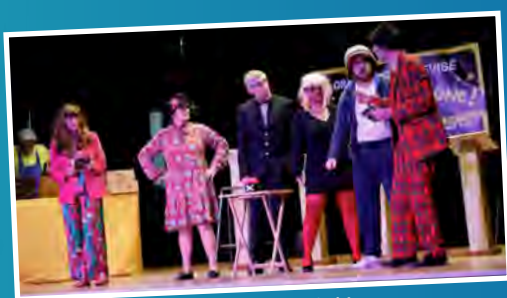
Compagnie de Théâtre Les Bolides de Mulsanne le 5 février