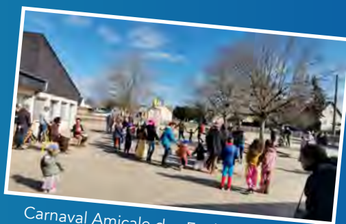
Carnaval Amicale des Ecoles le 4 mars