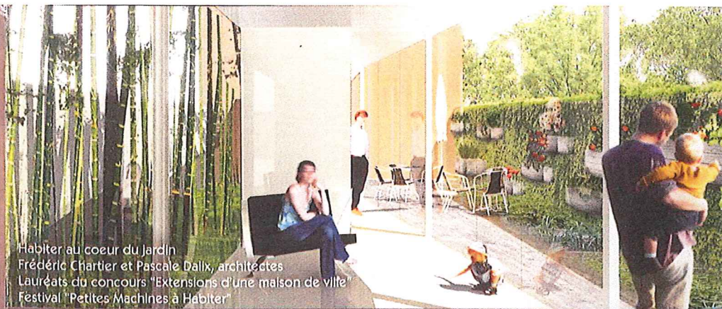
Habiter au cœur du Jardin Frédéric Chartier et Pascale Dalix, architectes Lauréats du concours "Extensions d'une maison de ville" Festival "Petites Machines à Habiter"

Graphisme : Stéphanie Gauthier, CAUE de la Sarthe - Texte : CAUE de la Vendée et DDE