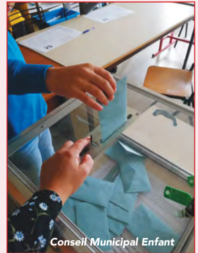
Conseil Municipal Enfant

Pour des raisons sanitaires «le devoir électoral» s'est effectué par classe où chaque élève déposait leur vote dans l'urne.