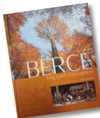
BERCE, une forêt d'exception de Yves Gouchet en vente en mairie - 23 Euros

2 Rue du Bourg Ancien, 72500 Jupilles - 02 43 38 10 31