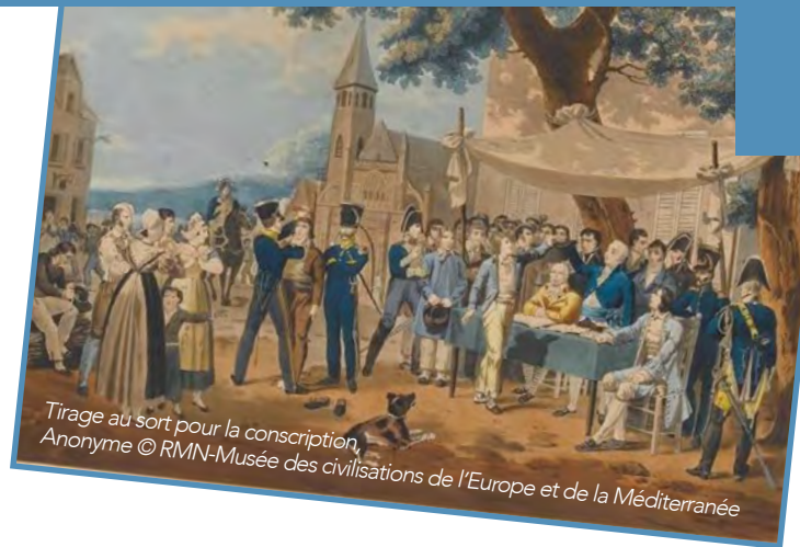
Tirage au sort pour la conscription, Anonyme