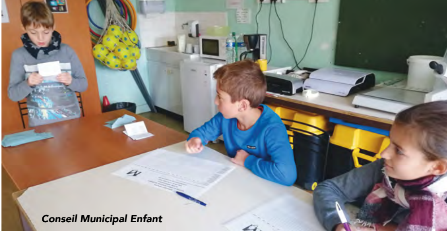
Conseil Municipal Enfant

La classe de découverte à Artigues ne pourra pas se tenir en mai 2021, étant donné les conditions sanitaires actuelles, et les incertitudes que cela engendre. Au vu des délais des dossiers à déposer (qui restent les mêmes quelles que soient le nombre de nuitées), de l'incertitude sanitaire et des préconisations officielles de l'inspection et de la direction académique, une sortie avec nuitées ne paraît pas envisageable pour cette année scolaire. Nous sommes les premiers à en être bien désolés.