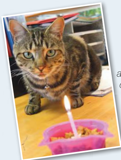
"Mbappé a fêté ses 1 an d'ancienneté"