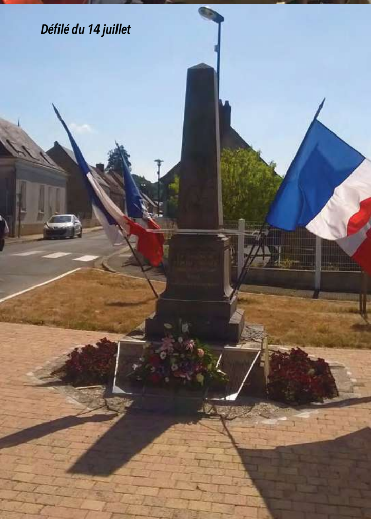
Défilé du 14 juillet