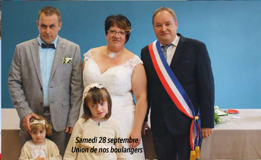
Samedi 28 septembre Union de nos boulangers