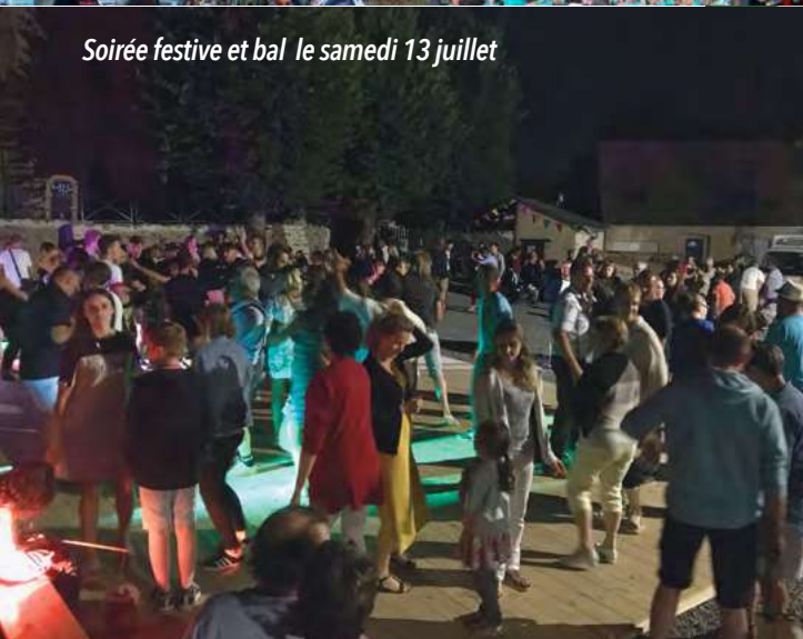
Soirée festive et bal le samedi 13 juillet