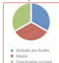
Participation au budget

Merci encore à la Mairie, à l'Amicale pour leur forte participation à notre voyage ! Merci aussi aux quelques parents qui ont organisé des ventes (en plus de celles de l'Amicale) afin de boucler le budget.