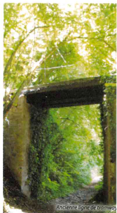
Ancienne ligne de tramway Des jonctions vers d'autres circuits sont possibles à partir de cette randonnée. Pour en savoir plus consultez le plan général.

La ligne de tramway dont on peut voir un vestige à Rochefort a été inaugurée en 1912. Elle reliait Jupilles au Mans, en passant par Saint-Mars-d'Outille. Les Saint-Martiens l'utilisaient pour livrer leurs productions, recevoir des marchandises lourdes, se rendre au marché... En 1947, en raison de la concurrence avec le trafic routier, la ligne a été fermée.