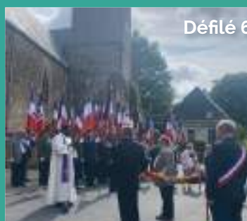
Défilé 6 juillet