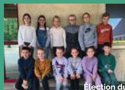
Élection du Conseil Municipal Enfant 14 juillet