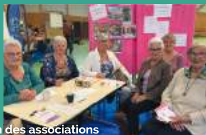
Forum des associations 7 septembre