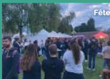
Fête nationale 12 juillet