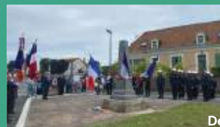
Défilé Fête nationale 14 juillet