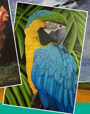
Les Arts à St Mars 15 & 16 novembre 2025