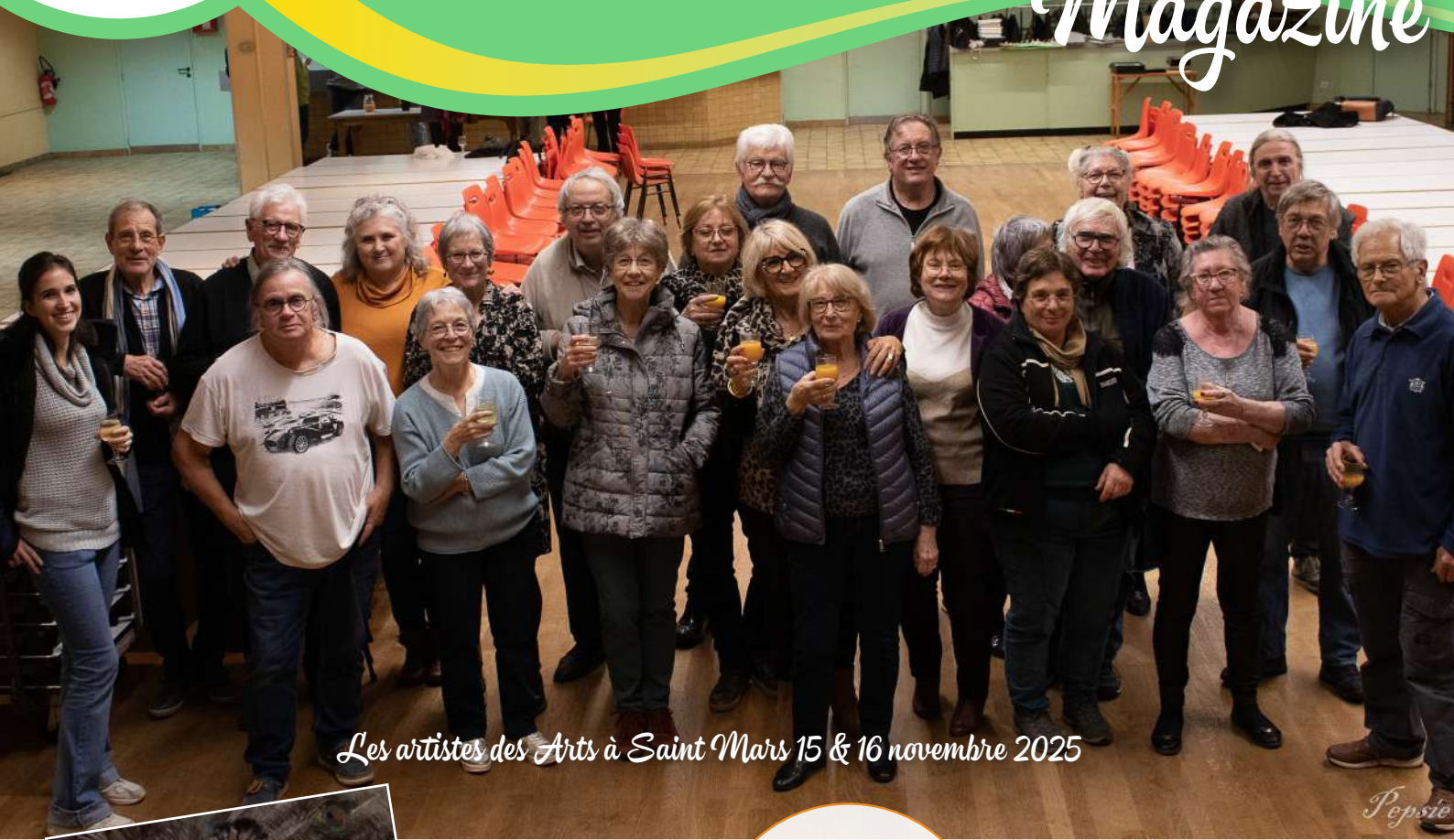
Les artistes des Arts à Saint Mars 15 & 16 novembre 2025