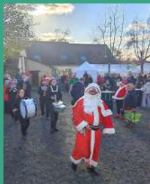
Marché de Noël Le 30 novembre 2025