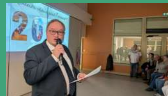
Vœux du Maire Le 16 janvier